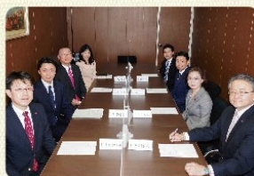
自民党議員会の役員会で重点政策について協議