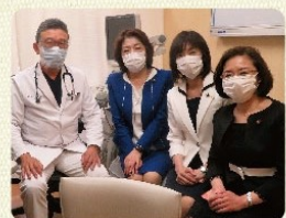
ワクチン接種の医療現場を視察