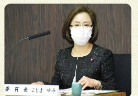
新型コロナ対策調査特別委員長として議事を進行