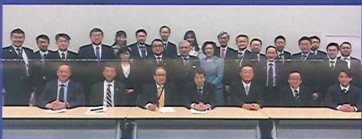
東京・自民党本部で各省庁や北海道代議士会に要望活動を実施(令和3年12月10日)