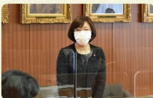
私立中高PTA連合会から教育関連の補助金増額について要望を受ける