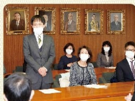
私立幼稚園連合会と処遇改善について意見交換